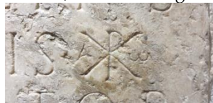
Première inscription chrétienne de Suisse

C'est le chef lieu valaisan, riche de 7000 ans d'histoire, qui nous accueille lors de cette seconde journée.