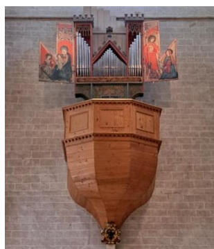
Valère, le fameux orgue