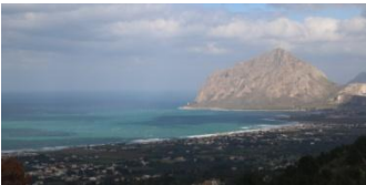
Vue depuis Erice