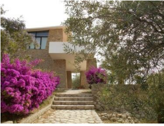
Riesi, centre d'accueil de l'Eglise Vaudoise