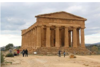
Agrigente, dans la vallée des temples

Après un bon petit déjeuner, nous quitterons le nord de l'île pour rejoindre le sud avec, en premier lieu, le grand parc archéologique de Sélinonte.