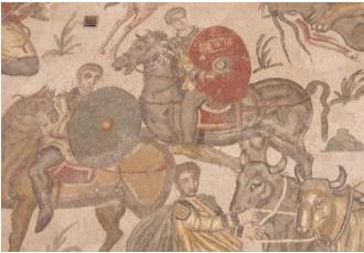
Villa Romana di Casale, détails d'une mosaïque

Changement de genre aujourd'hui : nous quitterons le sud pour le centre puis le nord de l'île.