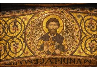
Chapelle palatine, détail

Aujourd'hui, c'est à la découverte de Palerme que nous irons.