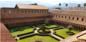
Monreale, le cloître