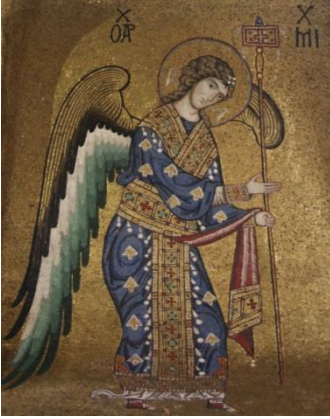
La Martorana, détail

En sortant du palais, vous aurez la possibilité d'aller librement visiter l'Église St Jean des Ermites voisine si le cœur vous en dit. Cette chapelle normande est de tradition architecturale byzantine et arabe, les normands ayant chassés les arabes, mais ayant gardé leur sens aigu de l'architecture.