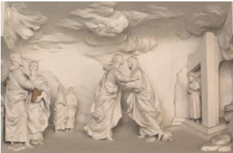
Sainte Cité, Annonciation

Tout d'abord nous rejoindrons l'Église de la Martorana, du XII ème siècle, construite en forme de croix grecque, elle aussi tapissée de splendides mosaïques.