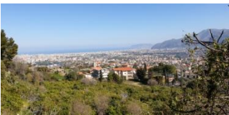
Palerme, vue de Monreale

Palerme n'ayant de loin pas épuisé tout ce qu'elle peut nous offrir, la journée sera libre de façon à ce que chacun puisse choisir ses lieux de visite, de flânerie, de boutiques, de repos... Des suggestions seront faites.