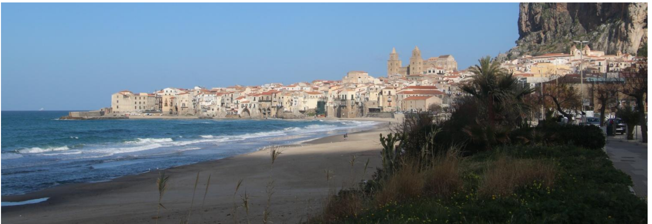
La magnifique ville de Cefalù...

NB: Des changements sont possibles, inversions de journées ou de parties de journées, voire des modifications de lieux visités selon les circonstances. Cependant, le maximum sera fait pour pouvoir visiter l'ensemble des lieux prévus.