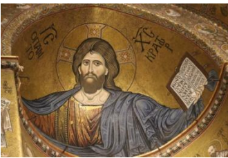
Monreale, Christ en gloire